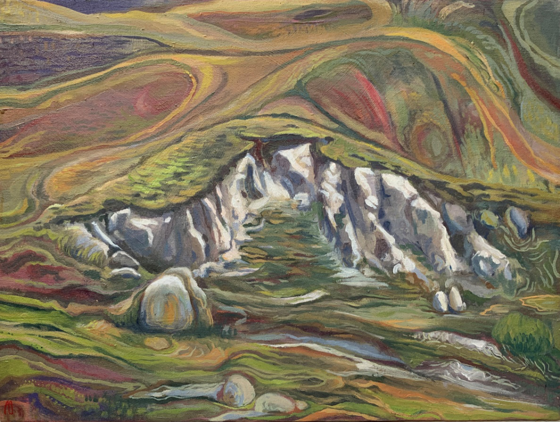
سفید کوچک (Tiny White) اکریلیک روی بوم (Acrylic on canvas) ۴۰*۳۰ سانتی‌متر (40*30cm)