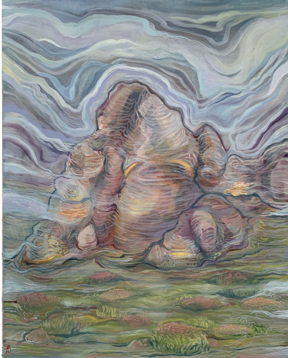
مه در آسیاب (Fog On The Mill) اکریلیک روی بوم (Acrylic on canvas) ۴۰*۵۰ سانتی‌متر (40*50cm)