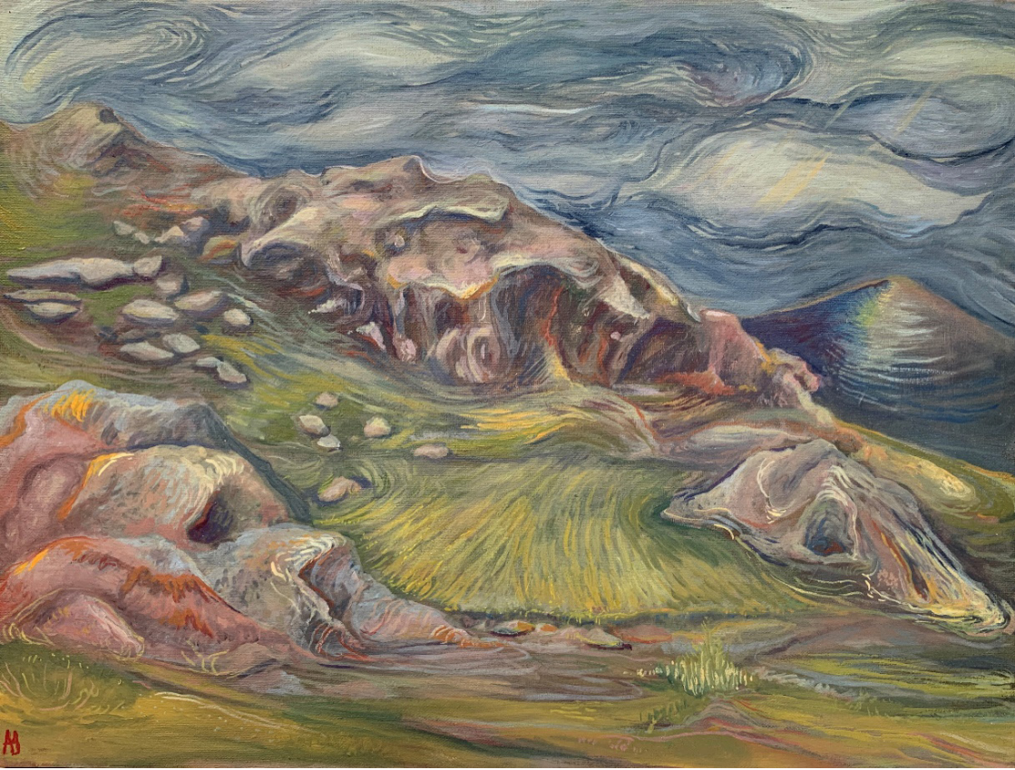
دروازه دو خرس (Gate of Two Bears) اکریلیک روی بوم (Acrylic on Canvas) ۴۰*۳۰ سانتی‌متر (40*30cm)