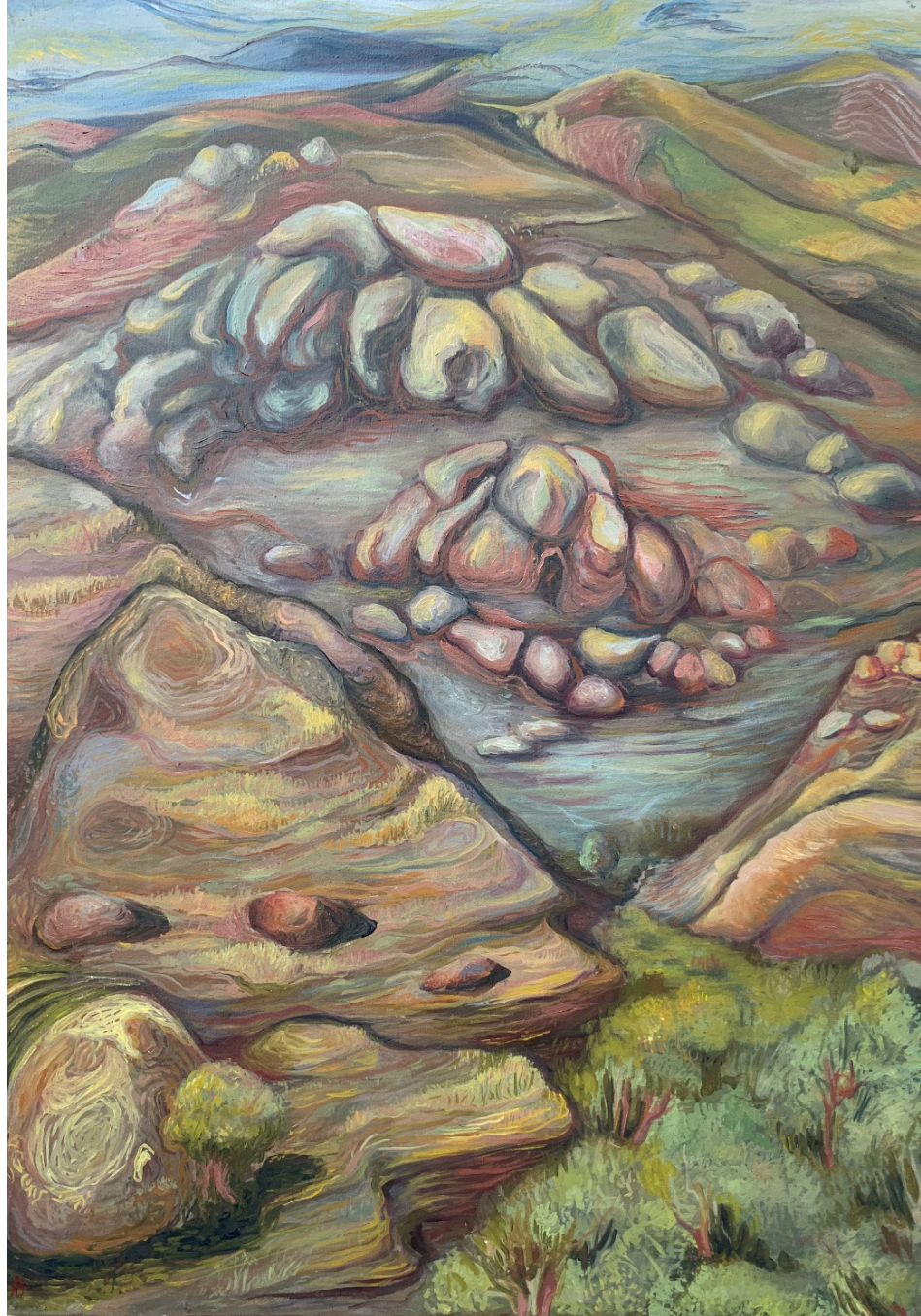
صخره‌های خاموش (Silent Rocks) اکریلیک روی بوم (Acrylic on canvas) ۷۰*۵۰ سانتی‌متر (50*70cm)