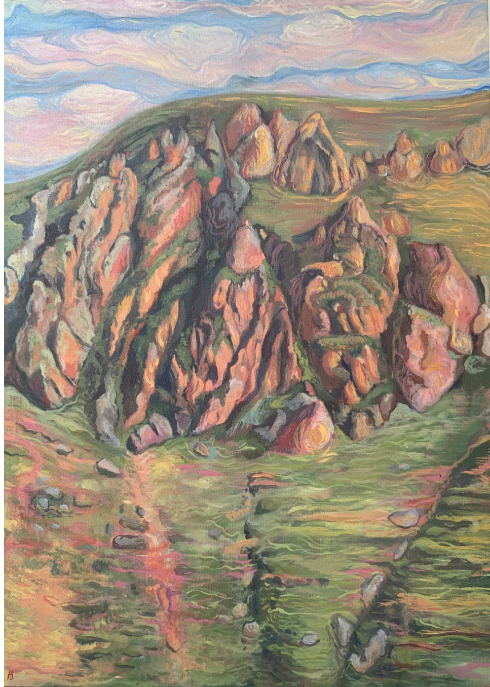
غول‌های آفتاب بوسیده (Sun-Kissed Giants) اکریلیک روی بوم (Acrylic on canvas) ۵۰*۷۰ سانتی‌متر (50*70cm)