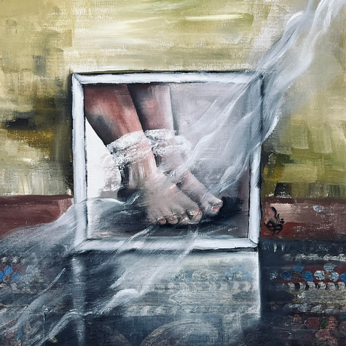
خاکستری کهنه ۲ (Old Gray 2) رنگ روغن روی بوم (Oil on canvas) ۲۵*۲۵ سانتی متر (25*25cm)