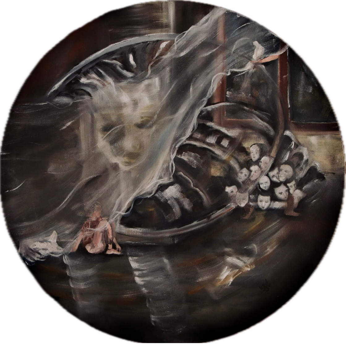
غریت خانگی (Home Seclusion) رنگ روغن روی بوم (Oil on canvas) ۵۰ سانتی‌متر (50cm)