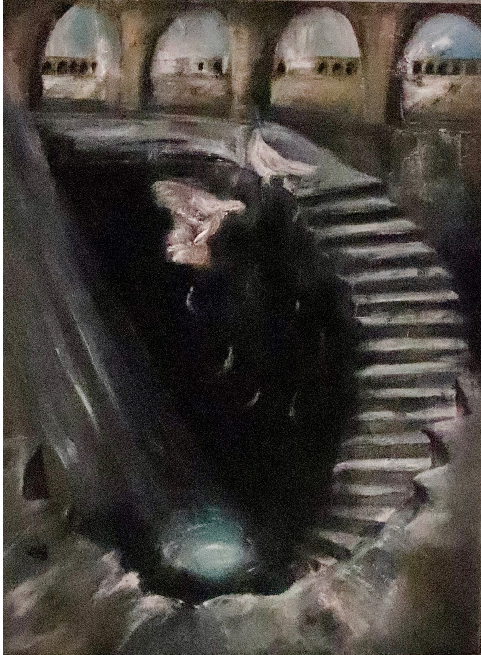
هر کسی را صبح امید است در دل های شب (The End of The Night is Black and White)