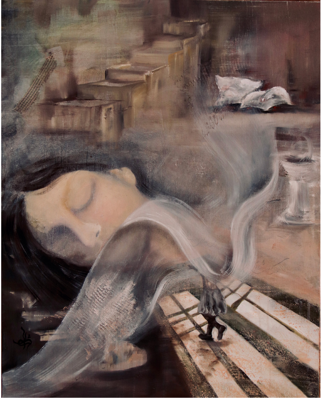
رویای خاکستری (Gray Dream) رنگ روغن روی بوم (Oil on canvas) ۴۰*۶۰ سانتی‌متر (40*60cm)