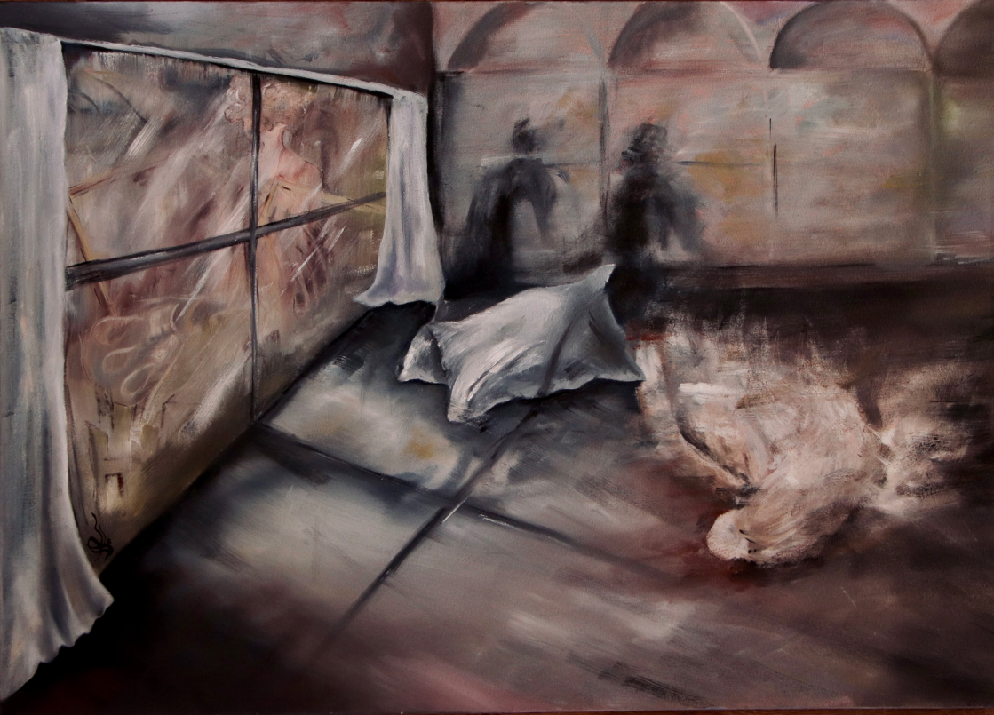
خاکستری قرمز (Shade of Ruddy) رنگ روغن روی بوم (Oil on canvas) ۷۰*۵۰ سانتی‌متر (50*70cm)