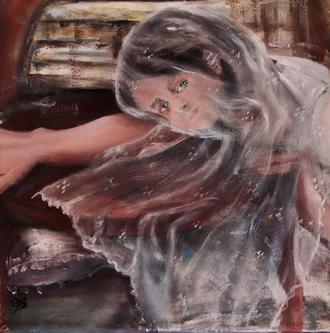
خاکستری سبز ۲ (Shade of Green 2) رنگ روغن روی بوم (Oil on canvas) ۲۵*۲۵ سانتی‌متر (25*25cm)