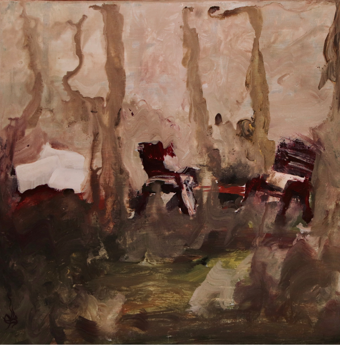
خاکستری دوره‌گرد ۲ (Wandering Gray 2) اکریلیک روی بوم (Acrylic on canvas) ۴۰*۴۰ سانتی‌متر (40*40cm)