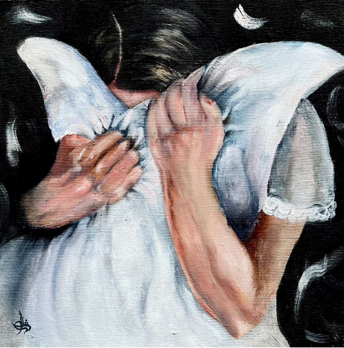
خاکستری خاکستر ۲ (Shade of Gray 2) رنگ روغن روی بوم (Oil on canvas) ۲۵*۲۵ سانتی‌متر (25*25cm)